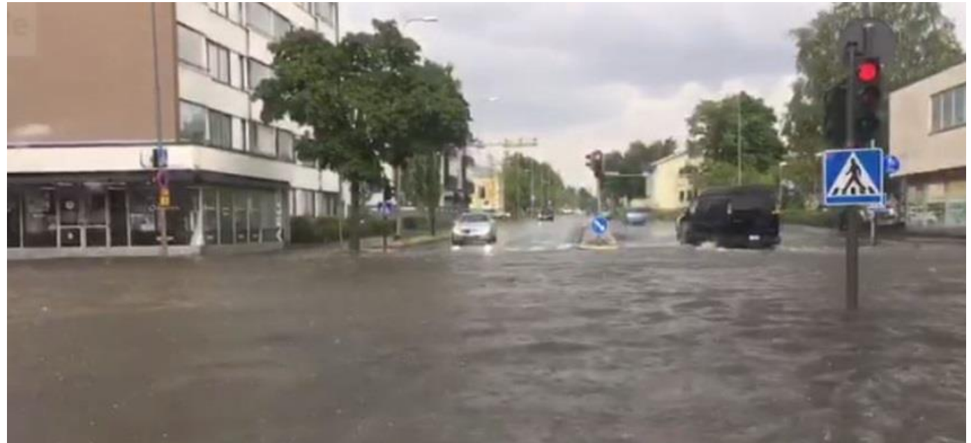
Kuva hulevesitulvasta kadulla.

Mikäli edellisellä kierroksella 2018 alustavassa arvioinnissa käytetyt tiedot eivät ole muuttuneet, tai muutokset ovat vähäisiä, riittää tämän toteaminen päätöksen yhteydessä alustavan arvioinnin tarkistamiseksi.